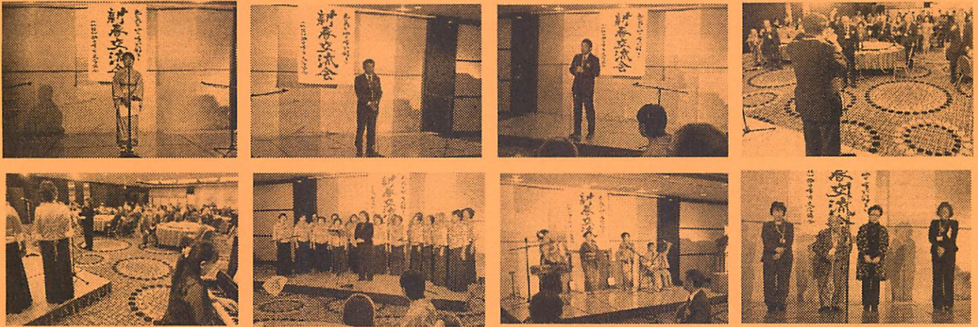
(会員によるコーラスや津軽三味線の演奏)